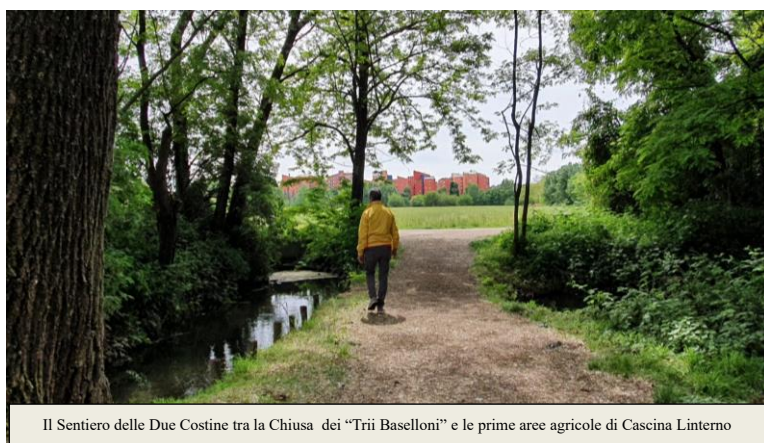
Il Sentiero delle Due Costine tra la Chiesa dei "Trii Baselloni" e le prime aree agricole di Cascina Linterno