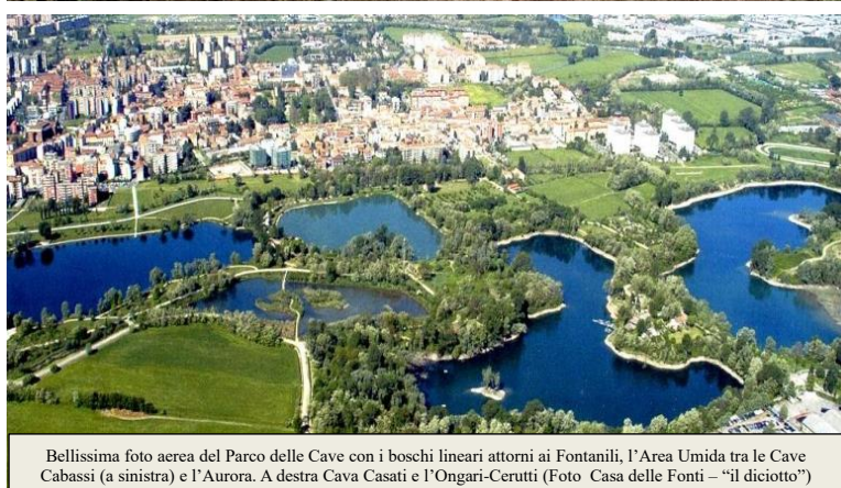
Bellissima foto aerea del Parco delle Cave con i boschi lineari attorni ai Fontanili, l'Area Umida tra le Cave Cabassi (a sinistra) e l'Aurora. A destra Cava Casati e l'Ongari-Cerutti

L'organizzazione declina ogni responsabilità per fatti e inconvenienti che dovessero verificarsi nel corso dell'iniziativa