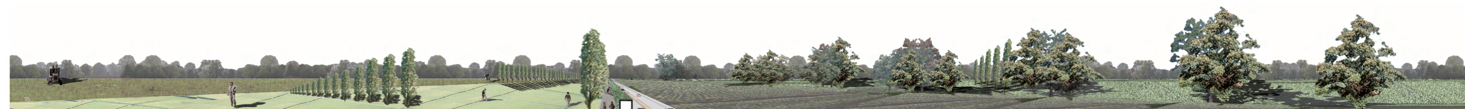
progetto campi coltivati percorso ciclopedonale S.s. 525 fascia tampone