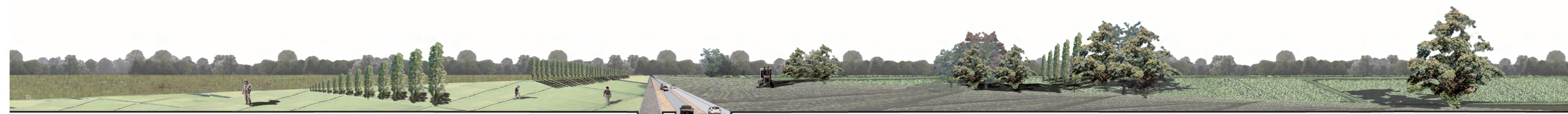
stato di fatto campagna ex sede tramviaria S.s. 525 campi coltivati