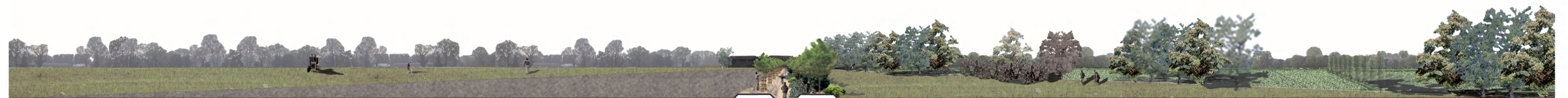
progetto: seconda fase campi coltivati filare campestre percorso ciclopedonale siepe campestre fascia tampone