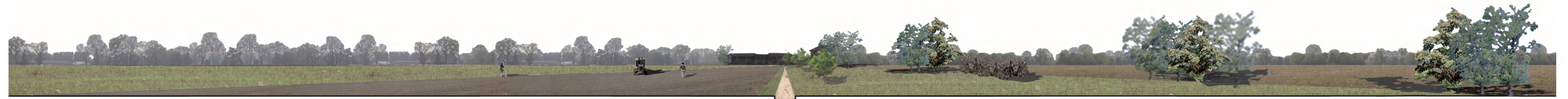
stato di fatto campi coltivati strada campestre campi coltivati