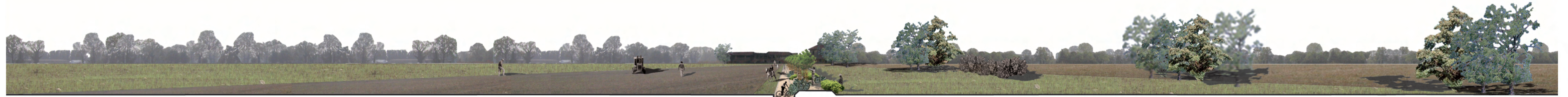
progetto: prima fase campi coltivati percorso ciclopedonale siepe campestre campi coltivati