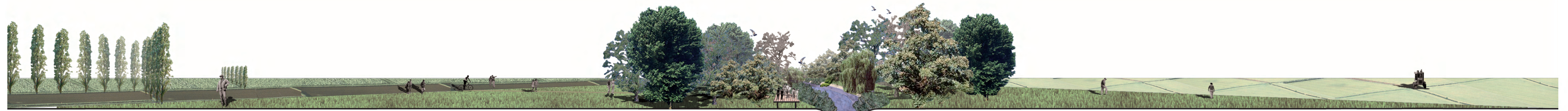
progetto: prima fase campi coltivati oasi naturale passerella ciclopedonale fontanile oasi naturale campi coltivati