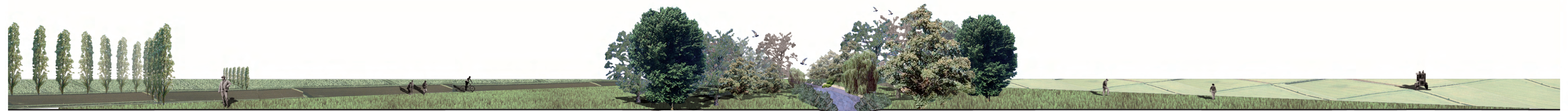
stato di fatto campi coltivati oasi naturale fontanile oasi naturale campi coltivati