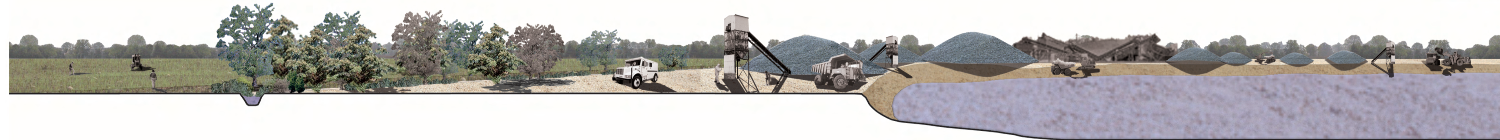
stato di fatto campi coltivati roggia area di pertinenza della cava cava