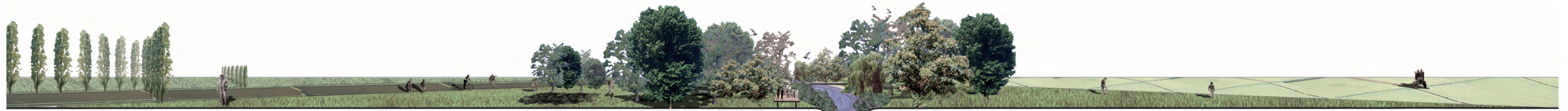
progetto: seconda fase campi coltivati oasi naturale passerella ciclopedonale fontanile oasi naturale campi coltivati