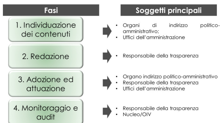
Figura 1- Le fasi di definizione del PTTI nelle Linee guida ANCI

Nell'impostazione del percorso di definizione del PTTI della Città metropolitana di Milano è stata individuata anche una fase preliminare, nella quale sono menzionati alcuni adempimenti che rappresentano il presupposto da cui partire per la definizione del programma stesso. La tabella 1 illustra nel dettaglio la procedura di definizione e aggiornamento del PTTI.