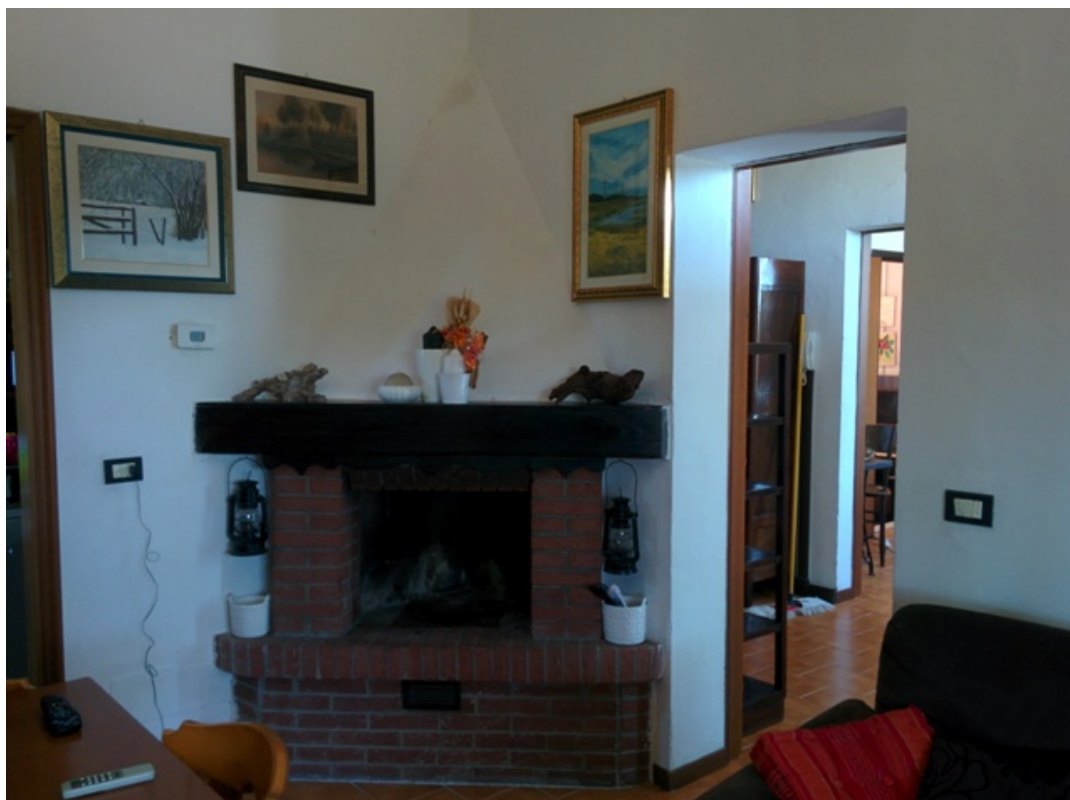
Vista interna studio