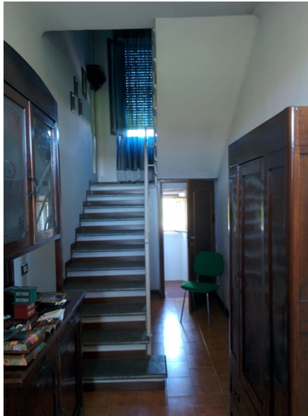
Stanza piano primo