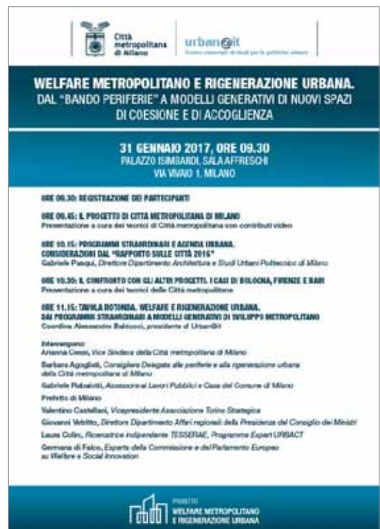
Esempio di un volantino.