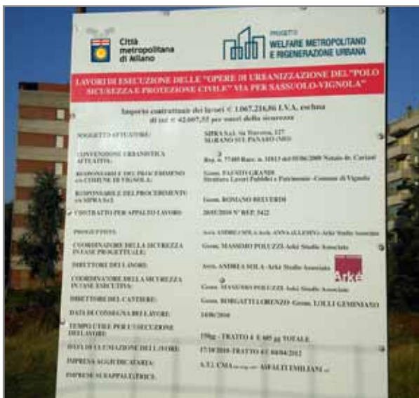
Esempio di un cartello lavori.