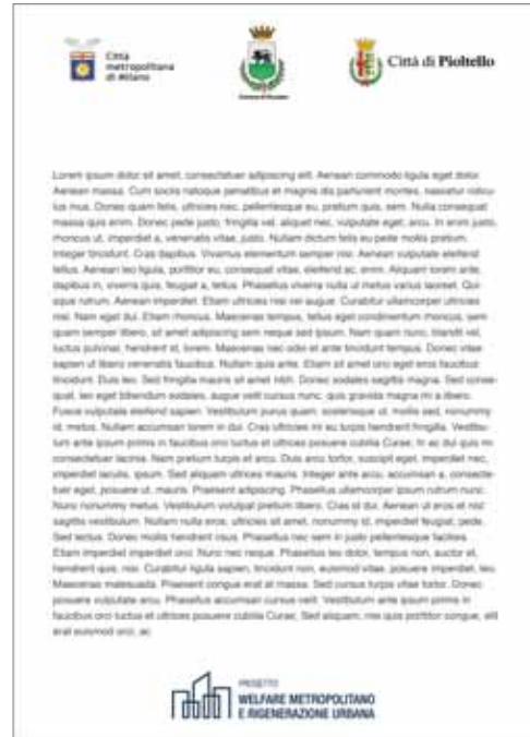
Esempio di un file di testo da personalizzare con più loghi, che andranno inseriti nell'intestazione. Quello del bando, invece, andrà posizionato a piè di pagina.