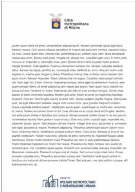
Esempio di un file di testo da personalizzare con il proprio logo.